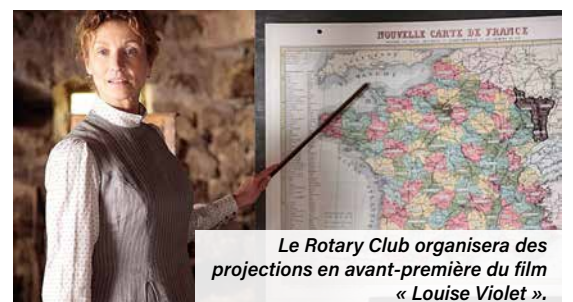
Le Rotary Club organisera des projections en avant-première du film « Louise Violet ».

Si le Rotary International est né au début des années 1900, le club domontois n'a été fondé qu'en 1979. Le Rotary club de Domont-Vallée de Montmorency s'est, notamment, manifesté dans la commune en 2021 avec un objectif : accompagner la Ville dans la valorisation de son patrimoine historique. Aujourd'hui il compte 11 adhérents et 2 membres honoraires. « Nous sommes un petit club d'amis qui ne demande qu'à