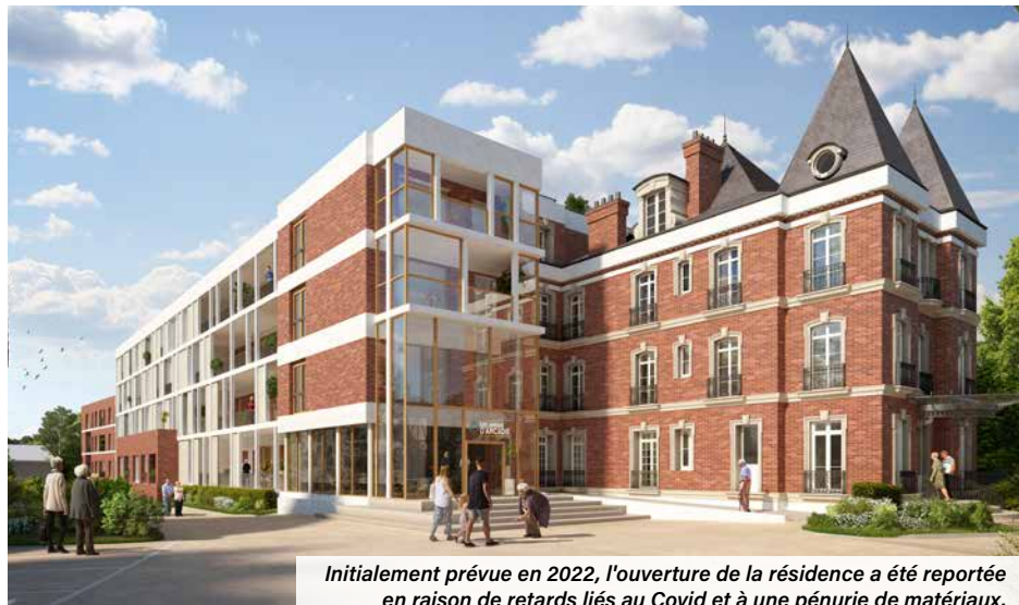
Initialement prévue en 2022, l'ouverture de la résidence a été reportée en raison de retards liés au Covid et à une pénurie de matériaux.

Implantée au 9 rue André Nouet, sur le site de l'ancienne clinique de Longpré, la résidence services seniors « Les Jardins d'Arcadie » ouvrira ses portes d'ici quelques mois. Elle propose à la location 110 appartements, du studio au T3.