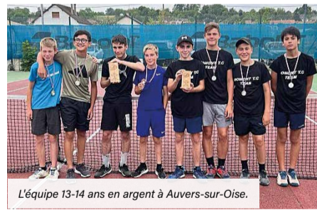
L'équipe 13-14 ans en argent à Auvers-sur-Oise.

> Renseignements au 01 39 91 77 43 ou sur www.club.fft.fr/domont.tc/