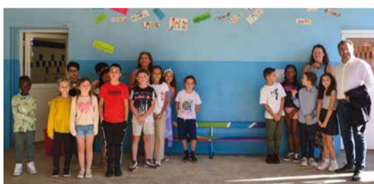
Le banc de l'amitié de Gabriel Péri.

Les écoles Gabriel Péri, Jean Moulin et Pierre Brossolette ont installé des « bancs de l'amitié » dans leurs cours de récréation. Objectif : encourager et développer des liens de sociabilité entre les élèves.