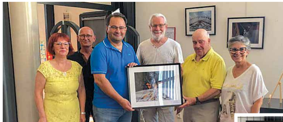
Lors du vernissage, le 9 septembre, le CID a fait don d'une photographie à la municipalité.

Bien plus que son atelier photographique, le Club informatique domontois s'intéresse à un grand nombre de disciplines, avec une vingtaine d'ateliers proposés chaque semaine à environ 200 adhérents de tous âges. Généalogie, robotique, photo, vidéo, bureautique, simulateur de vol et même mathématiques par le jeu... Chacun peut facilement trouver une activité correspondant à ses besoins ou à ses envies. Parmi les ateliers les plus prisés, ceux autour de l'apprentissage de l'ordinateur et d'internet, ciblant tout particulièrement les seniors. « Nous leur apprenons à utiliser un ordinateur afin qu'ils gagnent en autonomie et soient plus rassurés