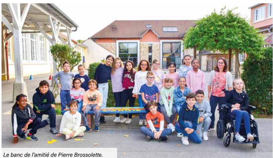
Le banc de l'amitié de Pierre Brossolette.

Un projet qui a également séduit le corps enseignant de l'école Jean Moulin, qui a elle aussi un « banc de l'amitié ». Il devrait prochainement être peint.