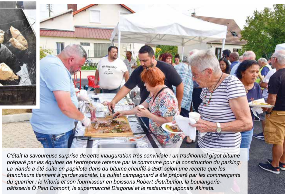
C'était la savoureuse surprise de cette inauguration très conviviale : un traditionnel gigot bitume préparé par les équipes de l'entreprise retenue par la commune pour la construction du parking. La viande a été cuite en papillote dans du bitume chauffé à 250° selon une recette que les étancheurs tiennent à garder secrète. Le buffet campagnard a été préparé par les commerçants du quartier : le Vitoria et son fournisseur en boissons Robert distribution, la boulangerie-pâtisserie Ô Pain Domont, le supermarché Diagonal et le restaurant japonais Akinata.