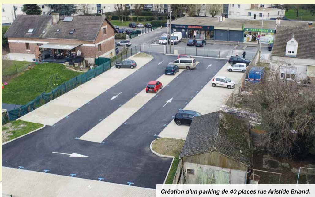
Création d'un parking de 40 places rue Aristide Briand.