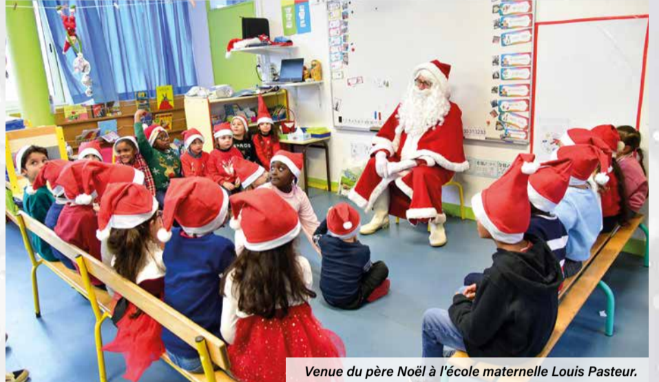
Venue du père Noël à l'école maternelle Louis Pasteur.