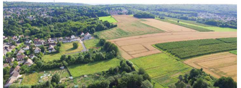
L'entrée en vigueur du nouveau Plan Local d'Urbanisme sanctuarise la plaine des Cercelets. Cet espace naturel se voit durablement protégé de toute urbanisation.

Je souhaite à tous les Domontois de trouver le courage nécessaire dans les périodes compliquées et d'être soutenus et encouragés par les bonnes personnes. Je souhaite également que nous gardions et respectons des valeurs communes. Le vivre ensemble doit être une valeur cardinale de notre quotidien, aussi bien à l'échelle communale que partout ailleurs dans notre pays et dans le monde. J'espère enfin des événements positifs en cette année 2024 qui puissent éclairer le parcours de vie et le destin de chacun, en particulier des plus fragiles.