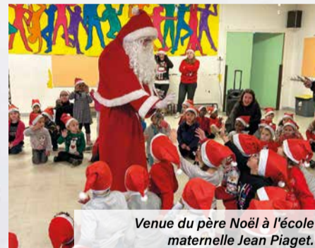
Venue du père Noël à l'école maternelle Jean Piaget.