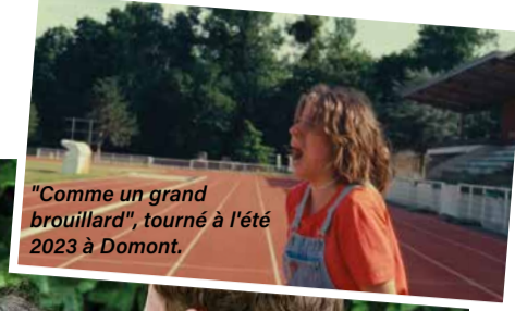
"Comme un grand brouillard", tourné à l'été 2023 à Domont.