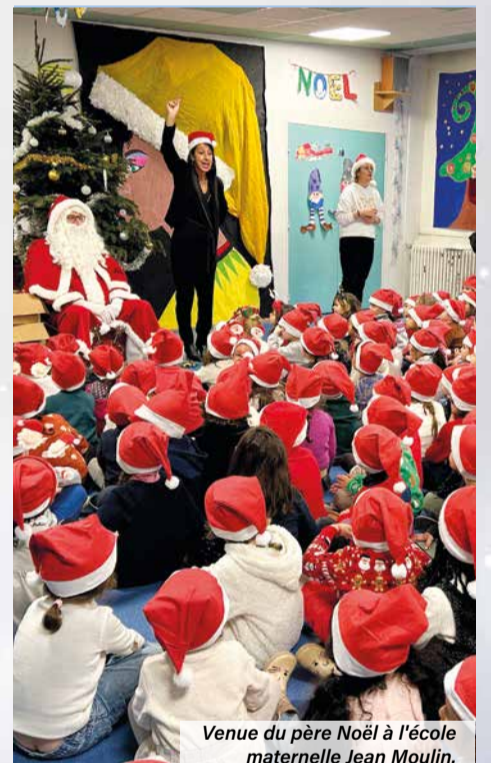
Venue du père Noël à l'école maternelle Jean Moulin.