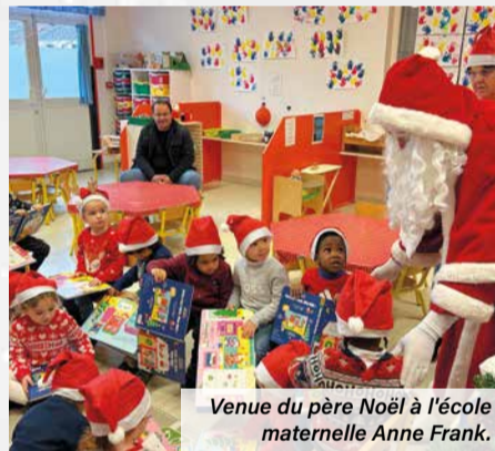
Venue du père Noël à l'école maternelle Anne Frank.