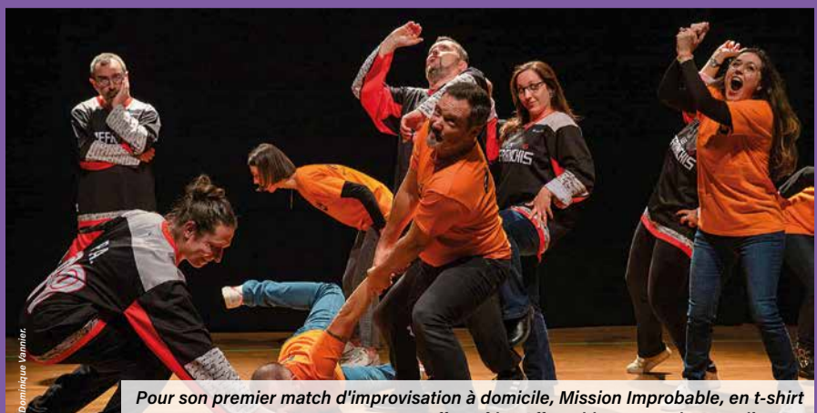
Pour son premier match d'improvisation à domicile, Mission Impossible, en t-shirt orange, a affronté Les Affranchis, troupe de Compiègnes.

Pour suivre les aventures de Mission Impossible, rendez-vous sur leur page Facebook et Instagram.