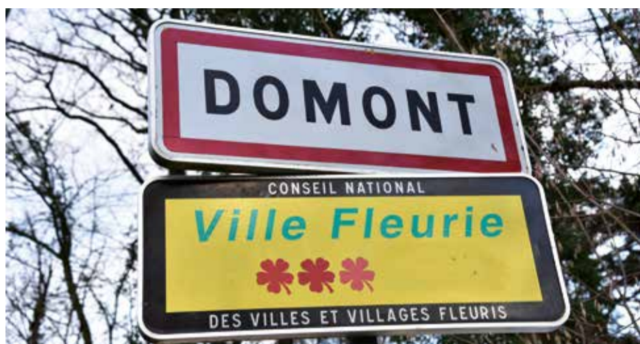
Domont a obtenu sa première fleur en 2006, sa deuxième en 2008 et sa troisième en 2016. Cette dernière a été confirmée par le jury en juillet 2019.

Application d'une politique zéro phyto, gestion différenciée des espaces verts, usage de produits bios, acquisition de matériel électrique, sensibilisation des plus jeunes, organisation d'un concours annuel autour du fleurissement... Autant de mesures qui ont une nouvelle fois contribué à convaincre le jury.